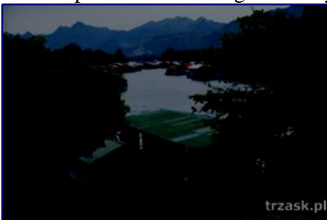
Kanchanaburi – miasto nad rzeką Kwai