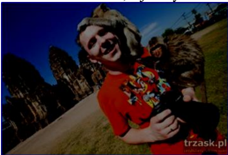
Małpy – nowi przyjaciele z Lopburi