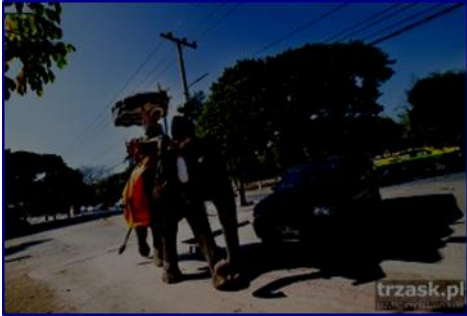
Słoniowa taksówka, Ajuthaya