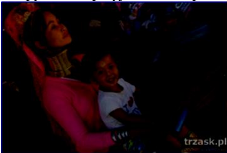
Wioska plemienia Padaung – kobiety żyrafy