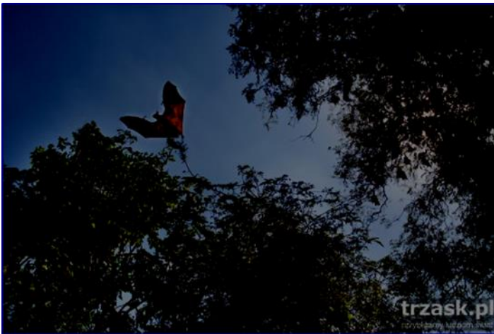
Nietoperze przy świątyni buddyjskiej w Bang Kla