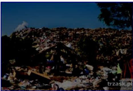
Obóz uchodźców z Birmy zlokalizowany na wysypisku śmieci, okolice Mae Sot