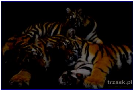
Półroczne tygrysy w rezerwacie Królestwo Tygrysów, okolice Chiang Mai