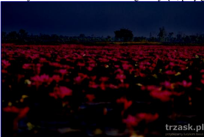
Red Lotus Sea