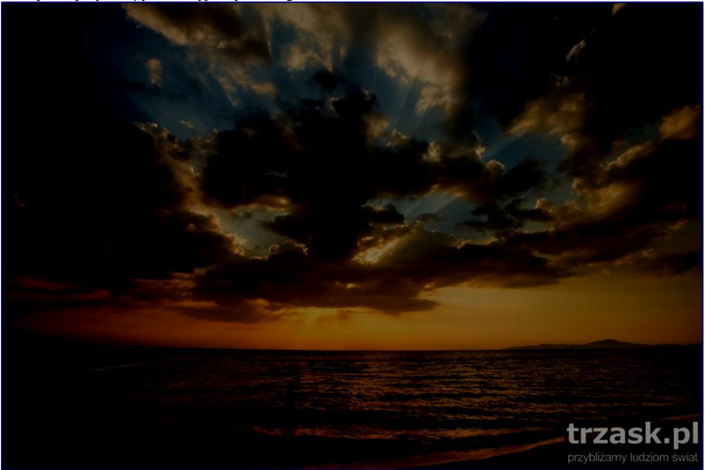
Zachód Słońca, Pattaya