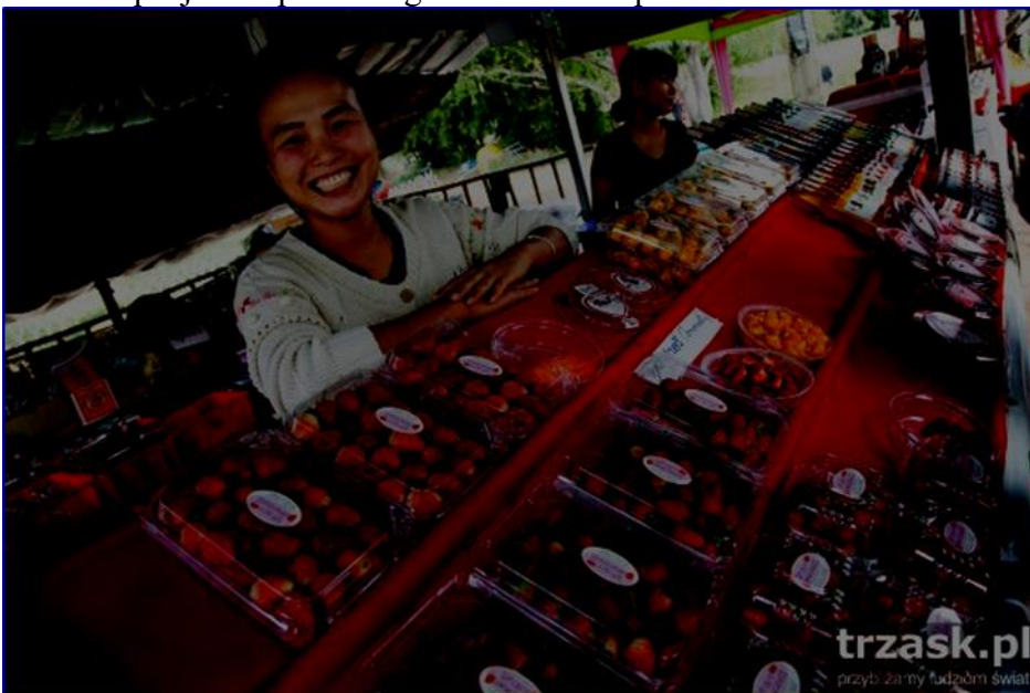
Plantacje truskawek – okolice Złotego Trójkąta, przy granicy z Birmą i Laosem